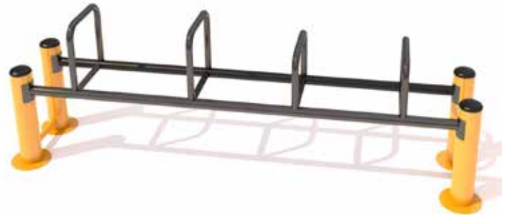
Mesa de ejercicios