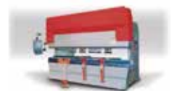
Dobladora de lámina CNC

INOPLAY® cuenta con materias primas, productos y/o procesos certificados