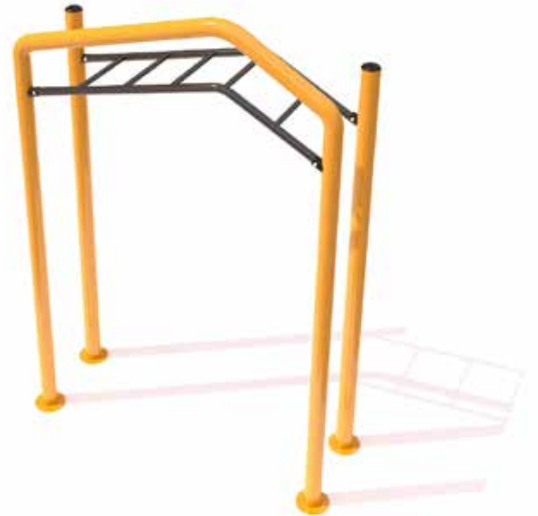
Monkey bar OP2 Código INP-CAL10 Acero al carbón, Pintura electrostática Dimensiones: 2.10 X 0.80 X 2.80 M