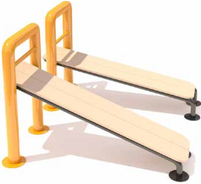
Camas Abdominales Código INP-CAL14 Acero al carbón, Pintura electrostática, HDPE Dimensiones: 1.60 X 0.75 X 1.10 M