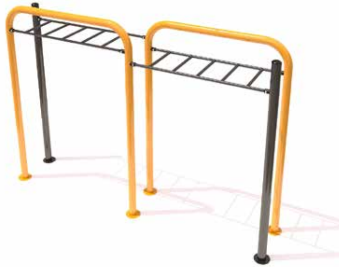
Monkey bar doble Código INP-CAL08 Acero al carbón, Pintura electrostática Dimensiones: 3.84 X 0.70 X 2.80 M