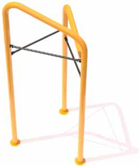
Barras dominadas triangular Código INP-CAL07 Acero al carbón, Pintura electrostática, Dimensiones: 1.55 X 1.30 X 3.15 M