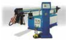
Roladora de Tubo CNC