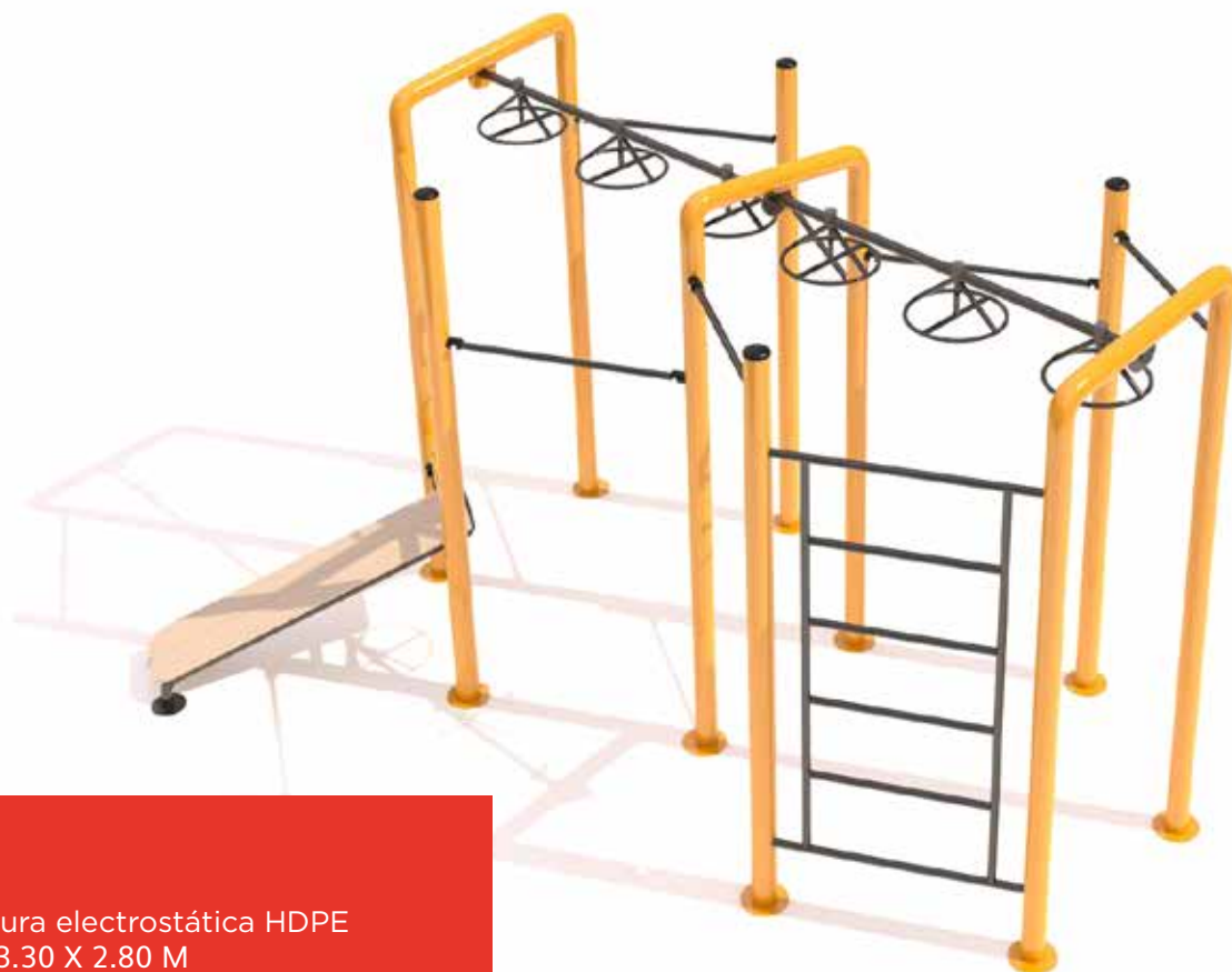
Isla de ejercicio 2 Código INP-CAL18 Acero al carbón, Pintura electrostática HDPE Dimensiones: 4.40 X 3.30 X 2.80 M