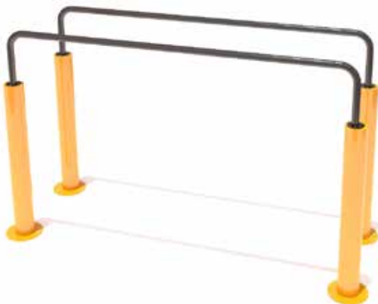
Barras paralelas Código INP-CAL02 Acero al carbón, Pintura electrostática Dimensiones: 2 X 0.70 X 1.17 M