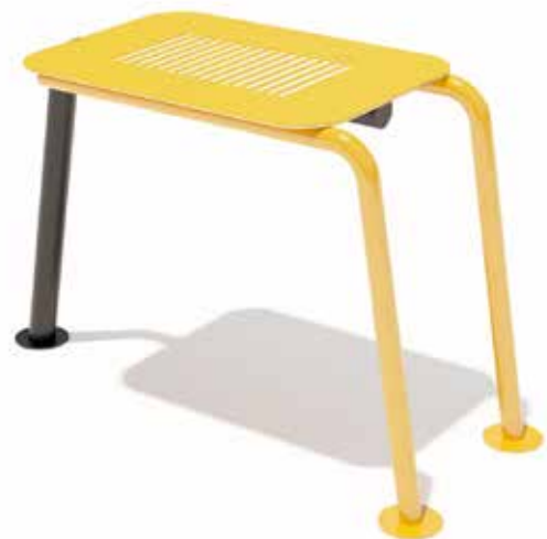
Banco grande Código INP-CAL03 Acero al carbón, Pintura electrostática Dimensiones: 1 X 0.45 X 0.60 M