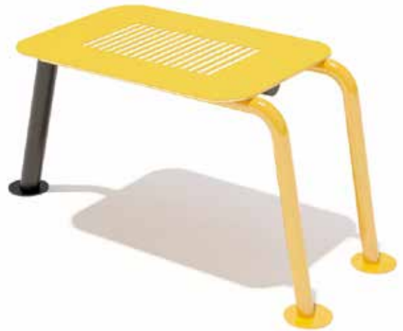
Banco mediano Código INP-CAL04 Acero al carbón, Pintura electrostática HDPE Dimensiones: 0.96 X 0.45 X 0.45 M