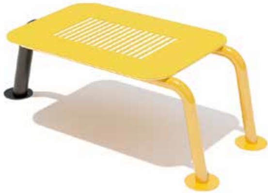
Banco chico Código INP-CAL05 Dimensiones: 0.91 X 0.45 X 0.30 M Acero al carbón, Pintura electrostática HDPE