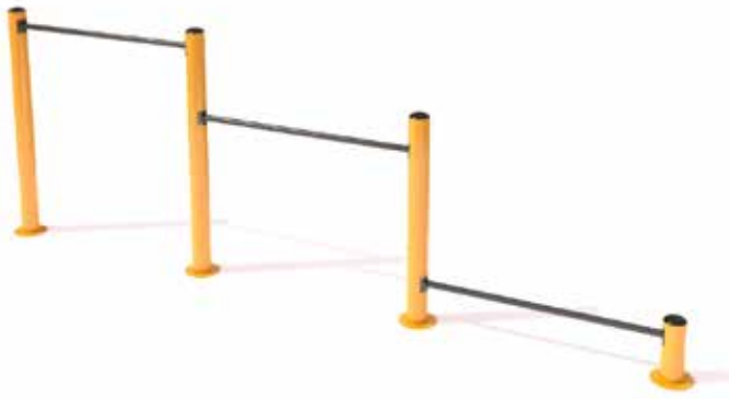
Barra de flexiones triple