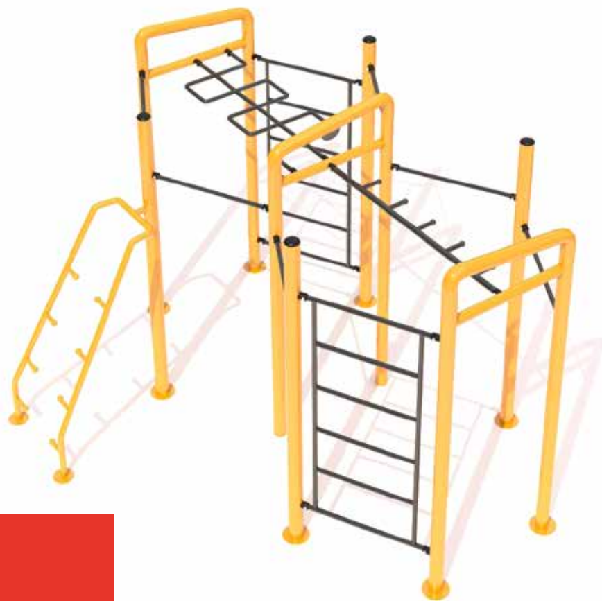
Isla de ejercicio 1 Código INP-CAL17 Acero al carbón, Pintura electrostática Dimensiones: 4 X 3.30 X 2.80 M