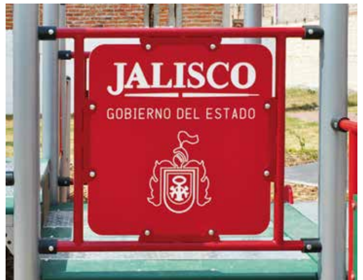
Detalle logotipo grabado