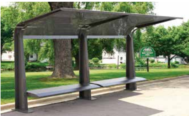
Urbansis // Parabuses