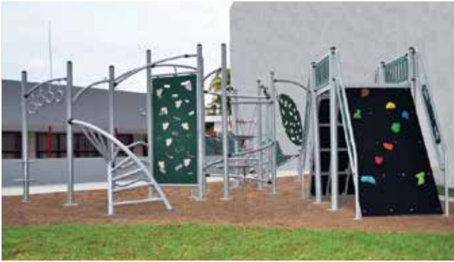
Inoclimb // Juegos para Trepar