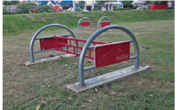
Inopet // Obstáculos para Perros