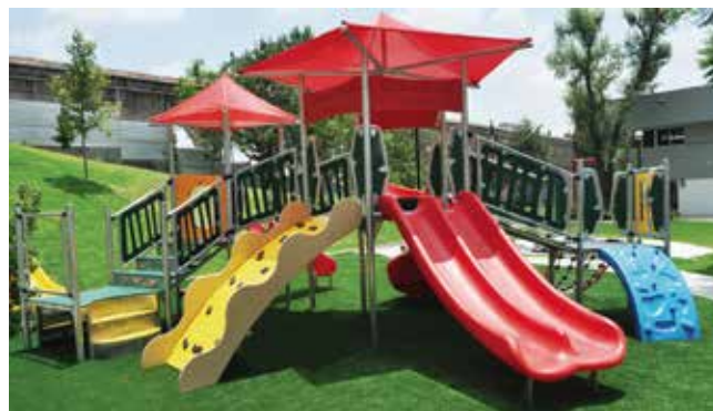
Polipay 40 // Islas de juegos modulares