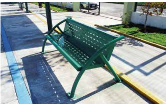
Urbansis // Bancas para Parque