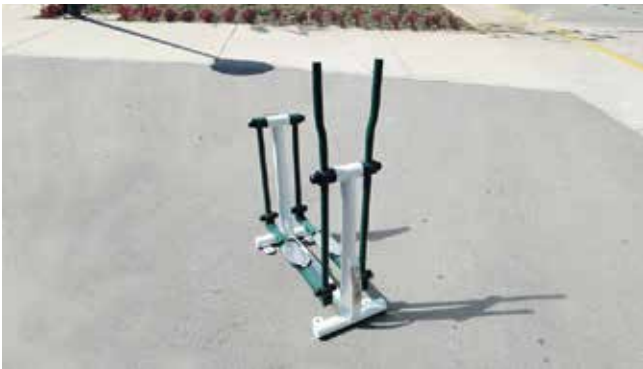
Exercis // Niños