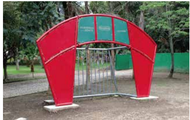
Inosport // Canchas de Usos Múltiples