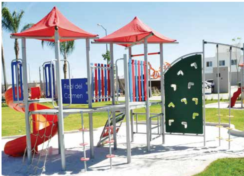
Fraccionamiento Real del Carmen