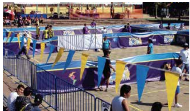
Inosport // Vallas de Separación