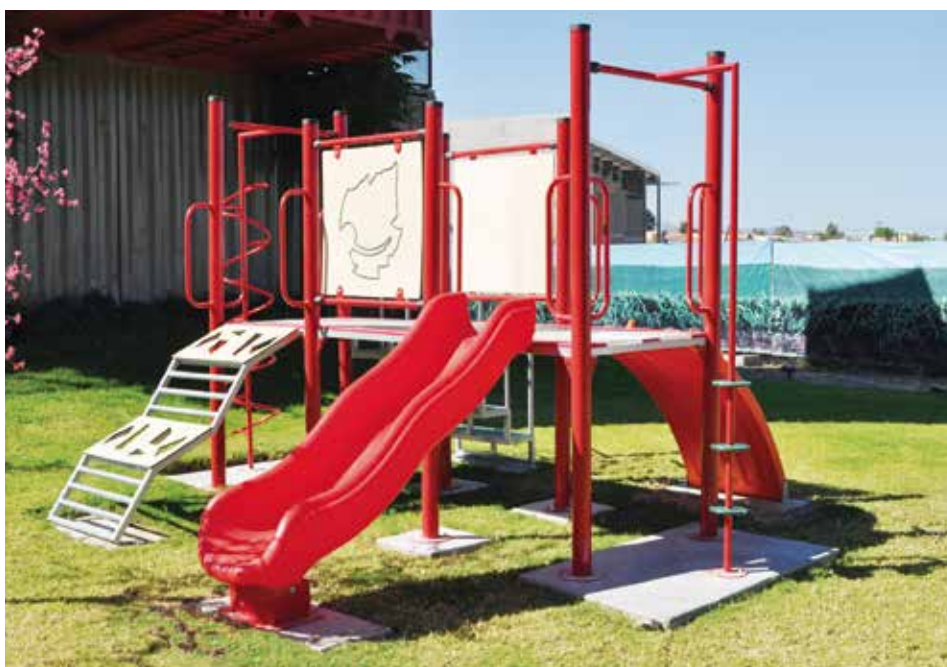
Fraccionamiento Reserva Real

Instalación de Juegos infantiles diseñados a medida y accesos personalizados.