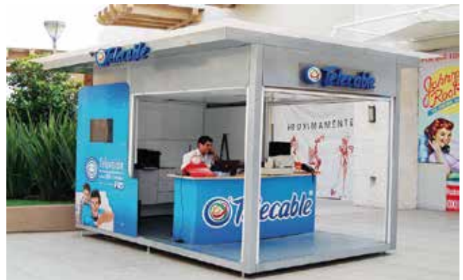
Urbansis // Quioscos Informativos