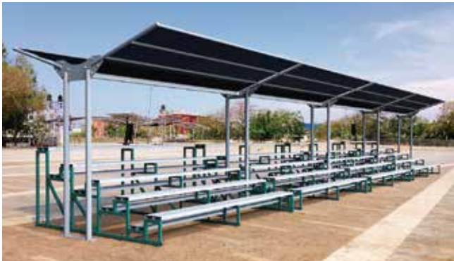
Inosport // Gradas y Toldos Modulares