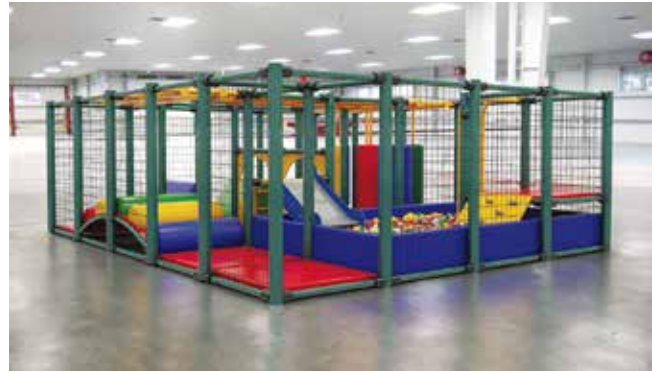
Interplay // Juegos para Interiores