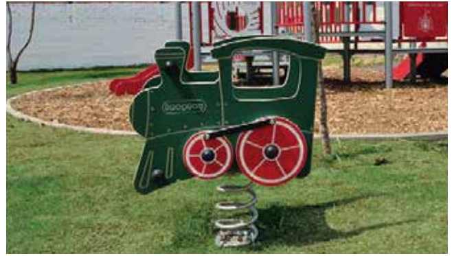
Inospring // Montables con Resorte