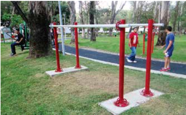
Ekotrain // Gimnasios al Aire Libre