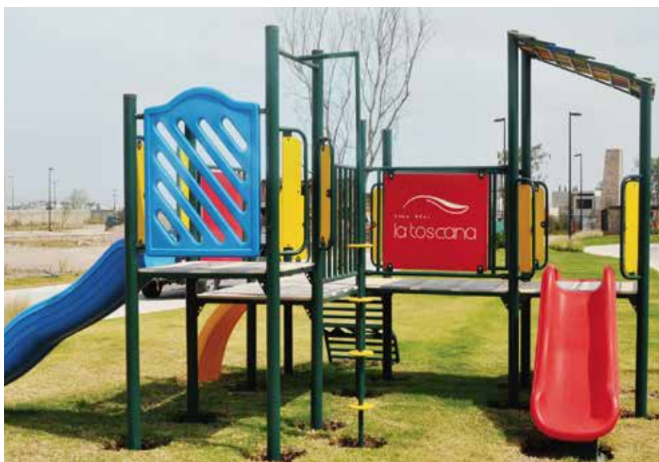
Fraccionamiento La Toscana

Instalación de Juegos Infantiles, Equipos de Gimnasio para exterior y mobiliario urbano personalizados para área común.