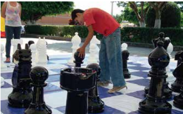
Inosport // Equipos Eventos Deportivos