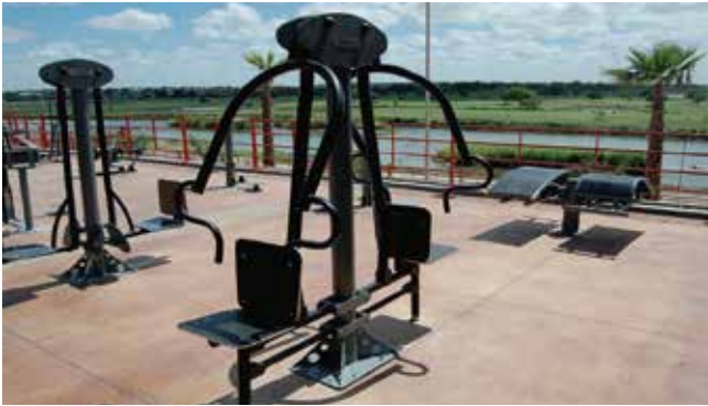
Exercis // Adolescentes y adultos