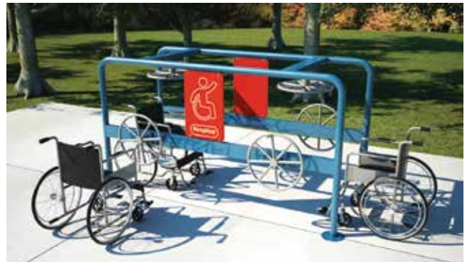
Exercis // Personas con Discapacidad