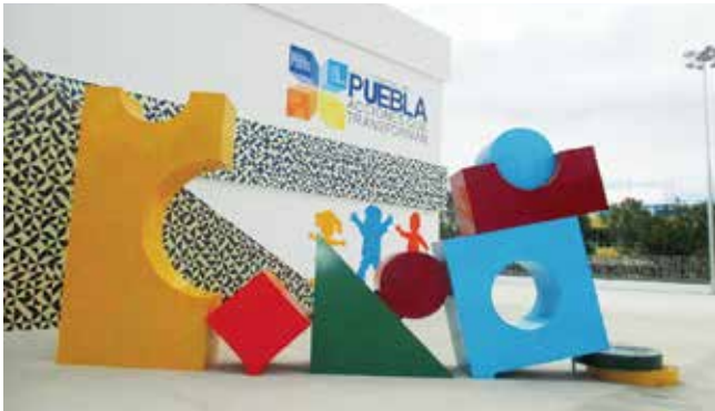
Urbansis // Monumentos y Esculturas