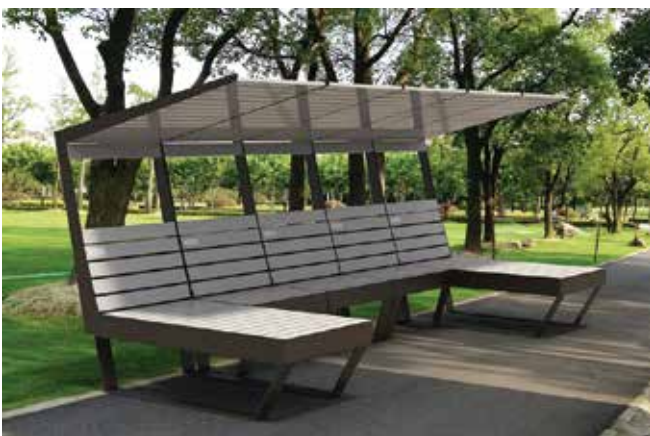
Inoshade // Pérgolas Pre-fabricadas