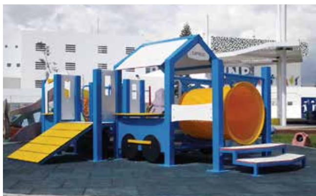
Toddlerplay // Juegos para Bebés Toddlers