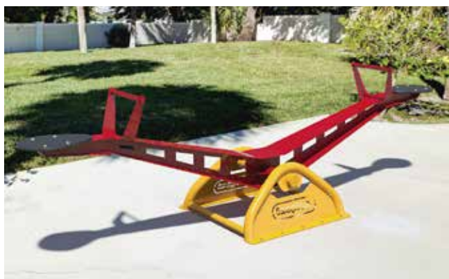
Inobalance // Sube y bajas