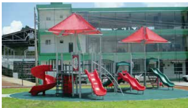
Polipay 60 // Islas de juegos modulares