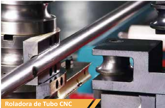
Roladora de Tubo CNC

En Inoplay® contamos con: Cortadoras CNC láser, punzonadoras CNC, router CNC, centros de maquinado, tornos CNC, roladoras CNC, dobladoras de tubo CNC, termoformadoras, hornos de pintura electrostática y soldadura de microalambre.