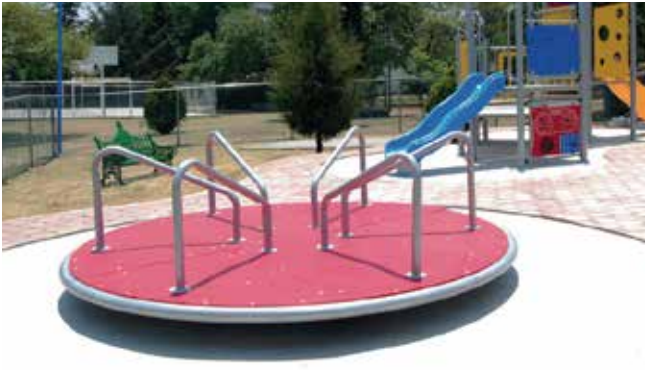
Inospin // Carrouseles y juegos giratorios