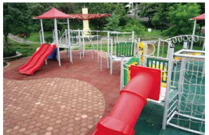
Inosurface // Pasto Sintético y Piso Granulado