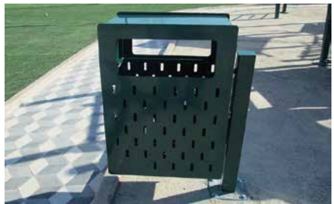
Urbansis // Basureros para Parques