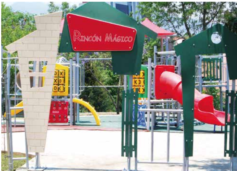
Fraccionamiento Rincón Mágico