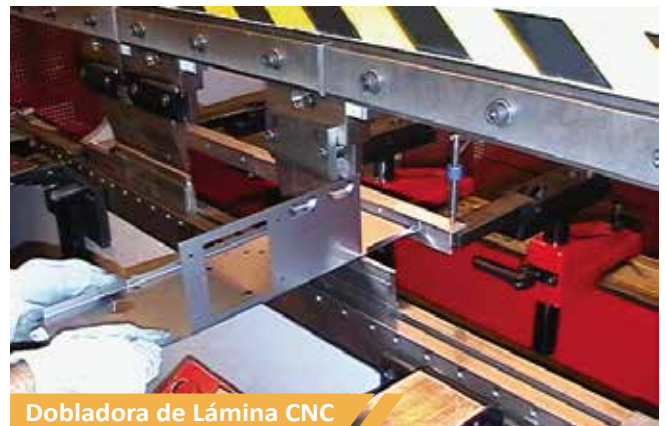
Dobladora de Lámina CNC