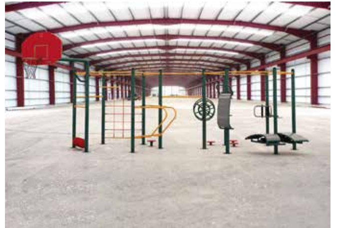
Inochallenge // Módulos de Calentamiento