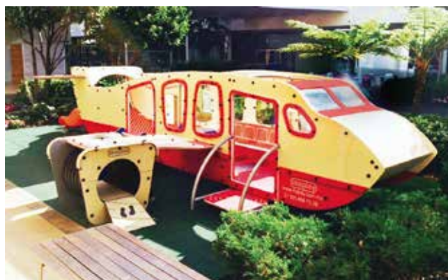
Inospecial // Juegos Temáticos