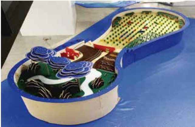
Eduka // Exhibiciones Educativas