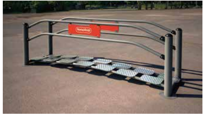
Exercis // Adultos Mayores