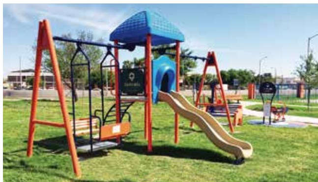
Polipay 20 // Islas de juegos modulares