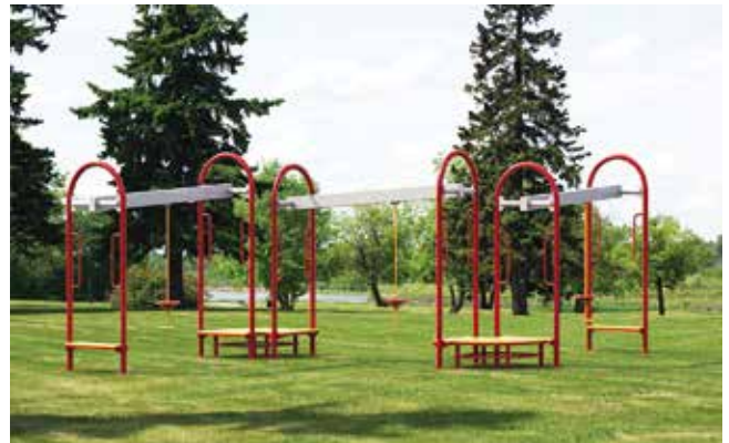
Inoziplay // Tirolesas Infantiles