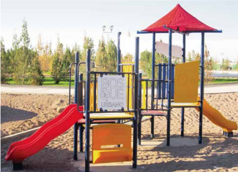
Fraccionamiento Bosque Urbano