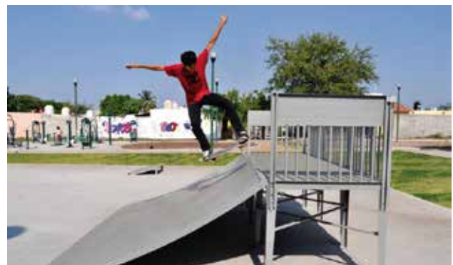
Inoskate // Pistas para Patineta