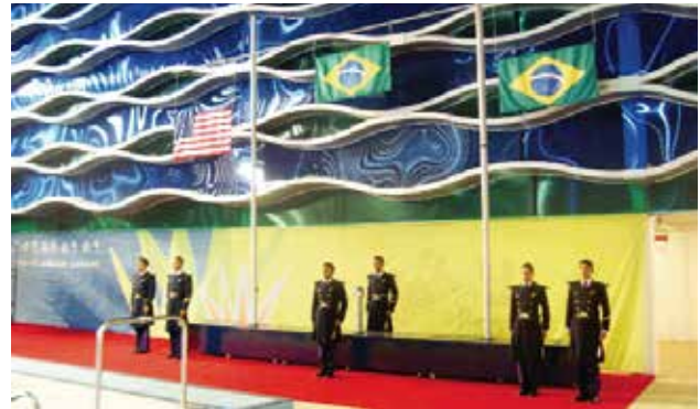
Inosport // Mobiliario para premiación