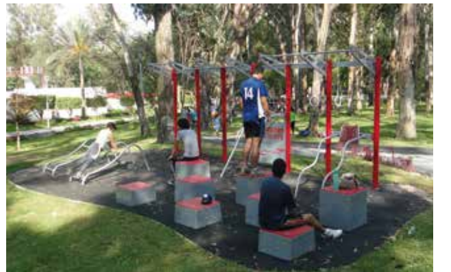
Crossfit // Alto Rendimiento