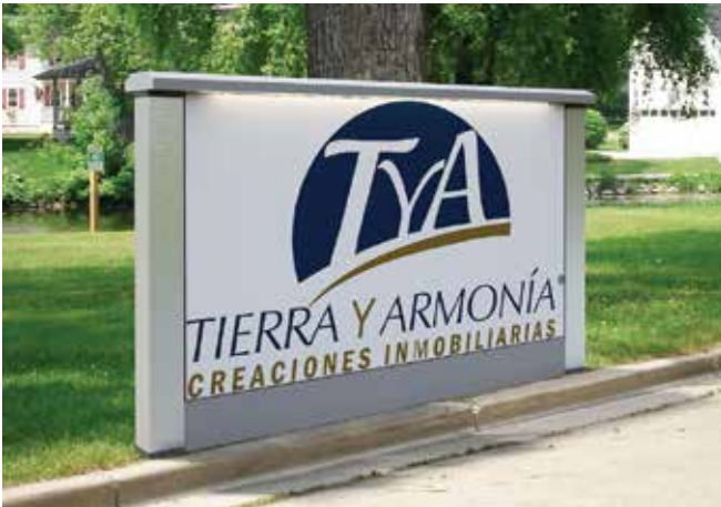
Inosign // Señalización Institucional