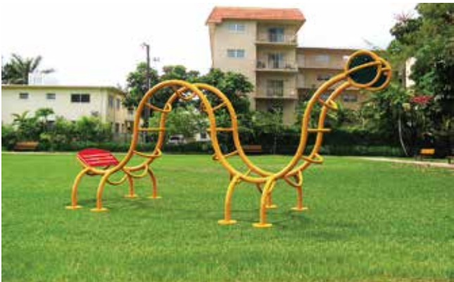
Ekonoplay // Juegos Económicos