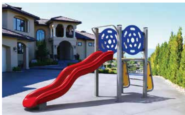
Inoslide // Resbaladillas y Toboganes