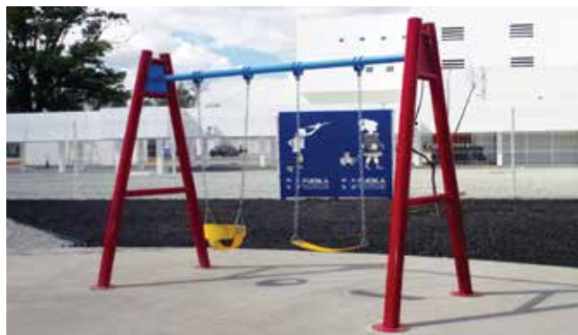
Inoswing // Columpios Infantiles