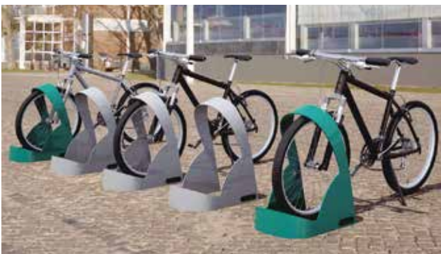
Inocycle // Aparcabicicletas