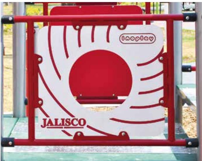
Detalle logotipo grabado

Inoplay® cuenta con un área de personalización y desarrollo de proyectos, en la cual, no sólo se tiene la opción de elegir los colores de los equipos (combinación de hasta 2) sino que tiene la posibilidad de hacer un traje a la medida de sus necesidades en todos los aspectos. Desde un simple boceto hasta proyectos integrales, nosotros le asesoramos para que el resultado final sea justo como lo imaginó.